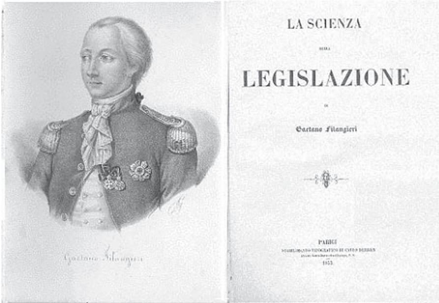
Fac. Símile da contra capa da obra “A ciência da legislação” publicada originalmente em 1780

Influenciado pelo iluminismo, ele sustentava a necessidade da existência da figura do “censor da lei” encarregado de remediar a multiplicidade de leis e de adaptá-las às mudanças. Tal estado seria causa de “felicidade” e propiciaria uma educação cidadã. Sua concepção de legislação propunha que esta atividade levasse em conta a economia e a política e que fosse um fator para geração de riquezas.