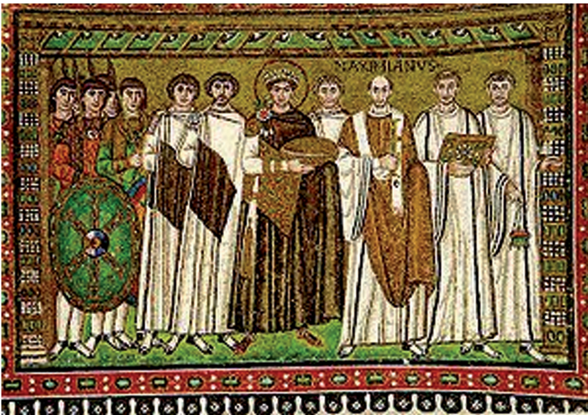
Detalhe de mosaico bizantino da Basílica de São Vital, em Ravena, datado do ano de 547 depois de Cristo. O imperador Justiniano encontra-se no centro, ladeado pelo seu séquito.

A Divina Comédia, dividiu e situou personagens históricas e acontecimentos em três partes : purgatório, inferno e paraíso. Justiniano, imperador romano responsável pela consolidação de leis romanas, foi enaltecido e colocado no paraíso de Dante,